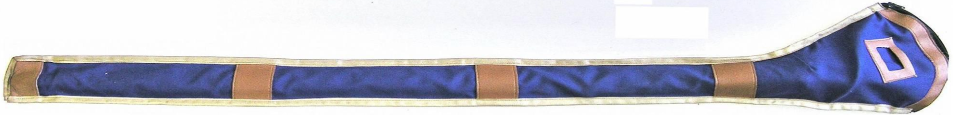
ΕΙΚΟΝΑ XIII ΛΕΠΤΟΜΕΡΕΙΑ ΠΑΝΩ ΤΜΗΜΑΤΟΣ ΕΞΩΤΕΡΙΚΗΣ ΥΦΑΣΜΑΤΙΝΗΣ ΘΗΚΗΣ ΞΙΦΟΥΣ