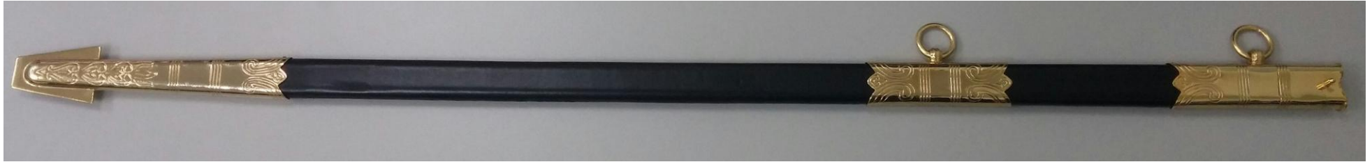
ΕΙΚΟΝΑ VII ΑΝΩ ΜΕΤΑΛΛΙΚΟ ΠΕΡΙΒΛΗΜΑ